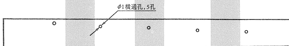
图 A.1 JM-1 型气门试块

A.1.4 试块尺寸为：12mm×12mm×120mm，在离检测面 1.5mm、2.5mm、3.5mm、4.5mm、5.5mm 各孔水平间距为 20mm 钻 \phi 1 mm 横通孔，五个横孔长均为 12mm，如图 A.1 所示。